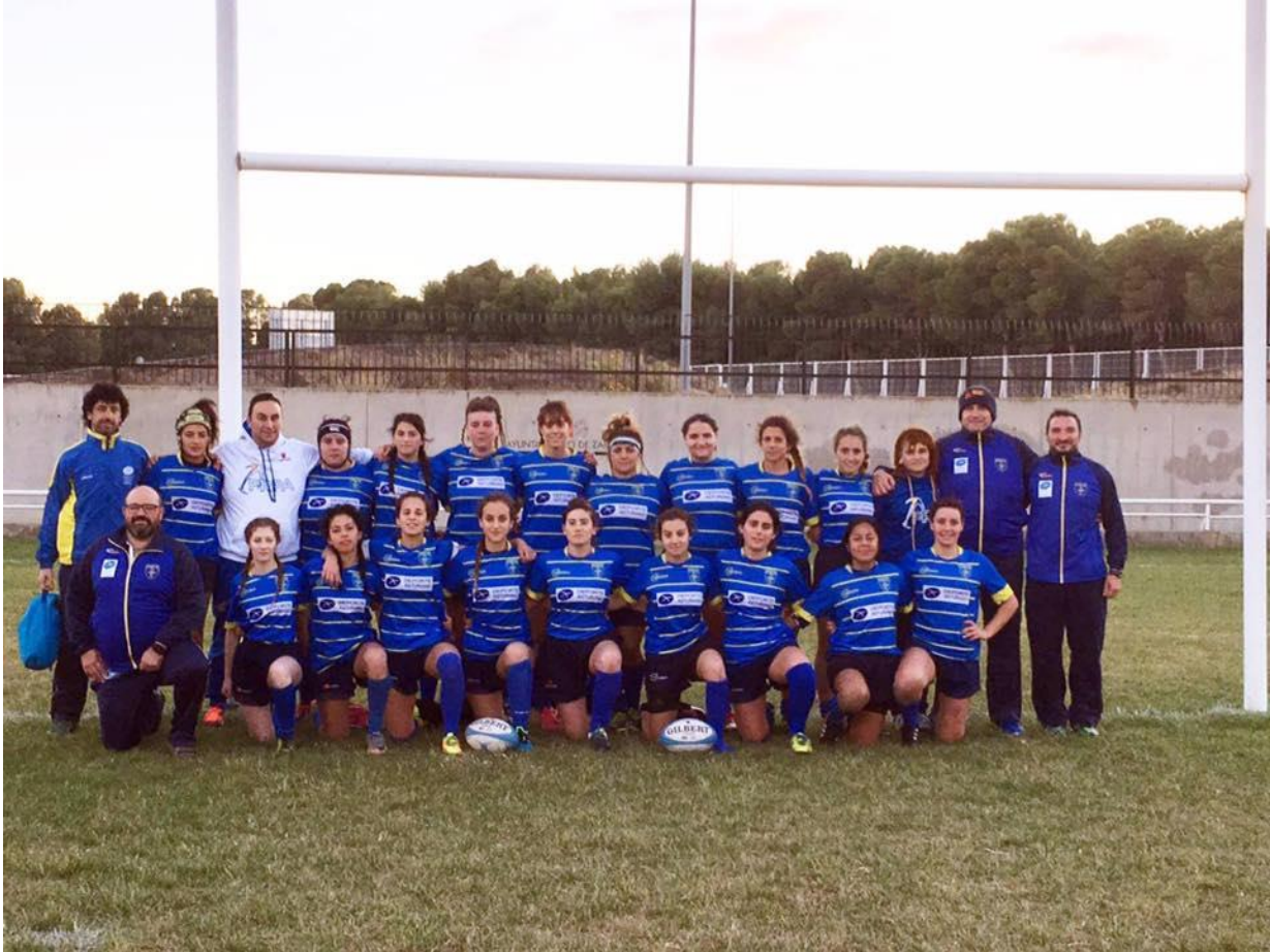
SELECCIÓN FEMENINA SENIOR EN ZARAGOZA ASTURIAS ARAGON CESA B