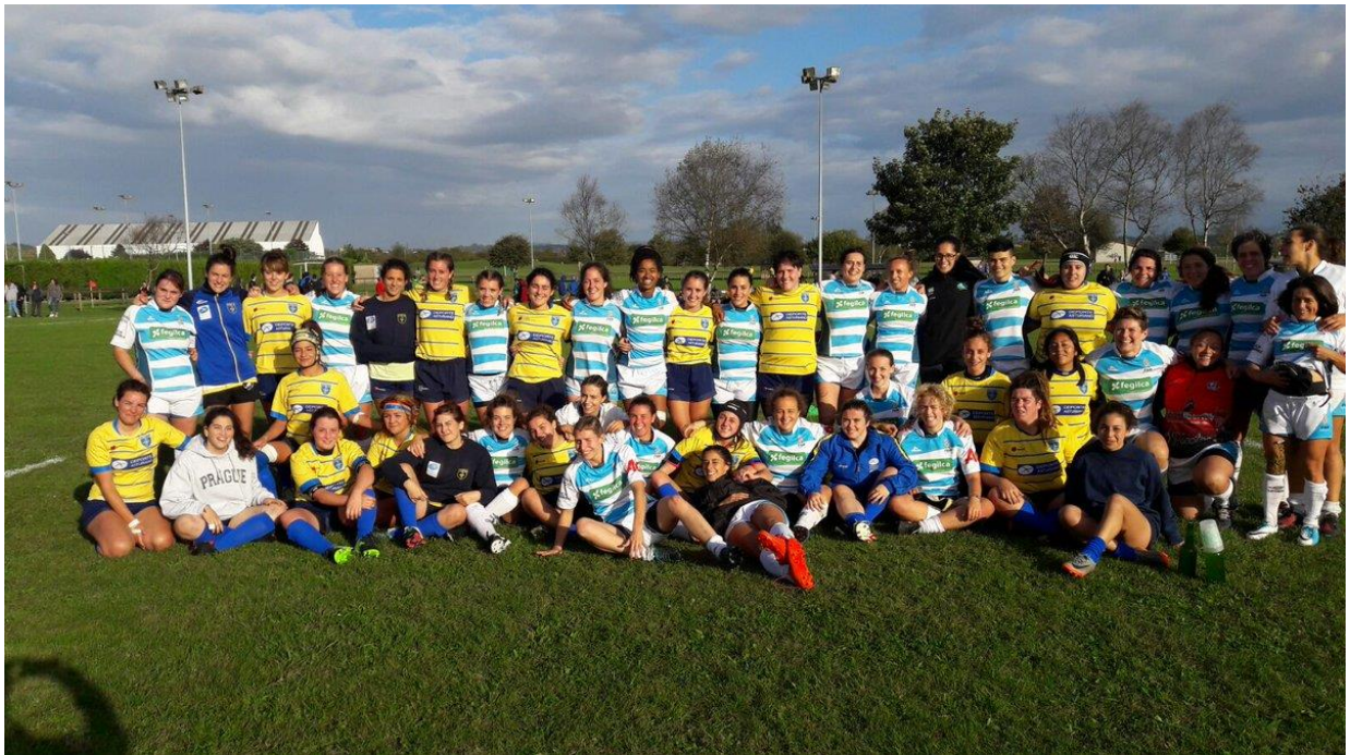
SELECCIÓN FEMENINA Y GALLEGA EN LA MORGAL ASTURIAS GALICIA CESA B Campos de la Guinadera, Sant Cugat 27 y 28 de Mayo de 2017