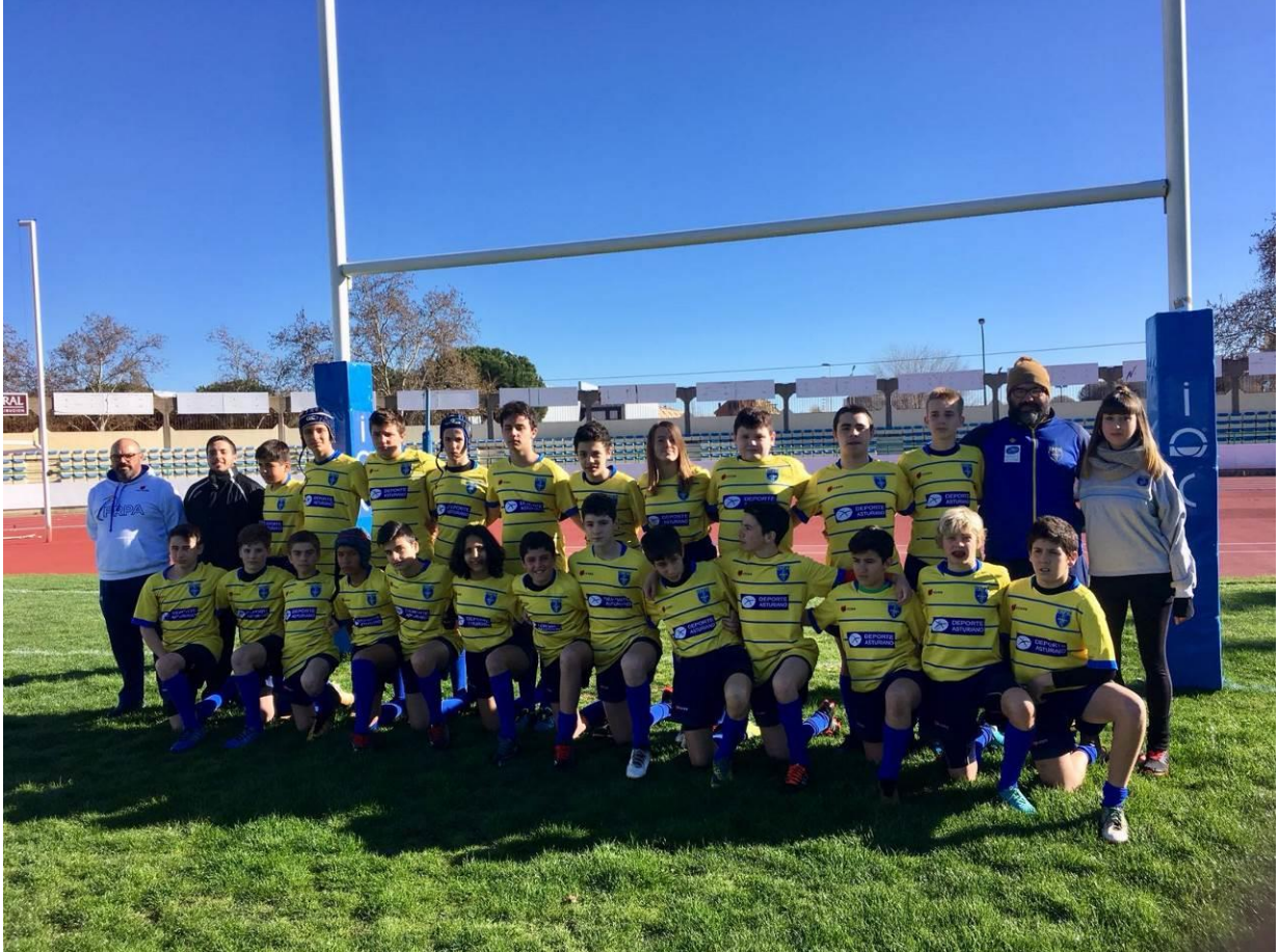
SELECCIÓN S14 CESA en Puertollano