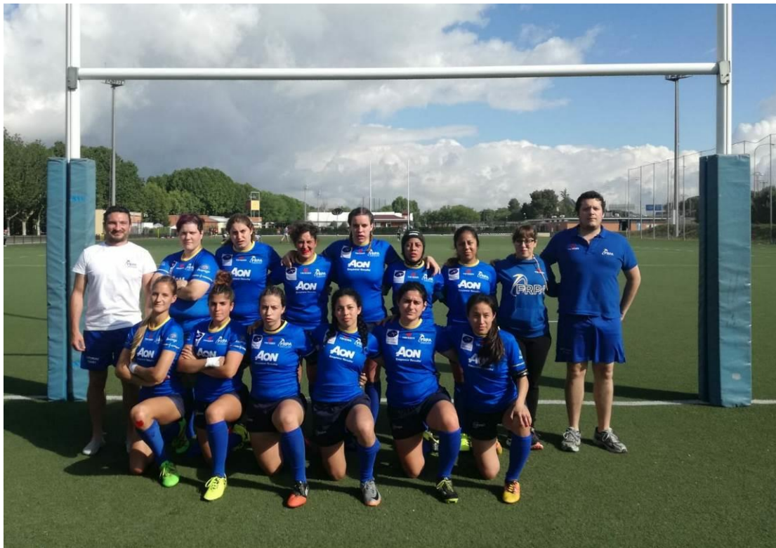
SELECCIÓN FEMENINA DE RUGBY 7 XXVII Torneo Cisneros. 4º Puesto. Junio 2018