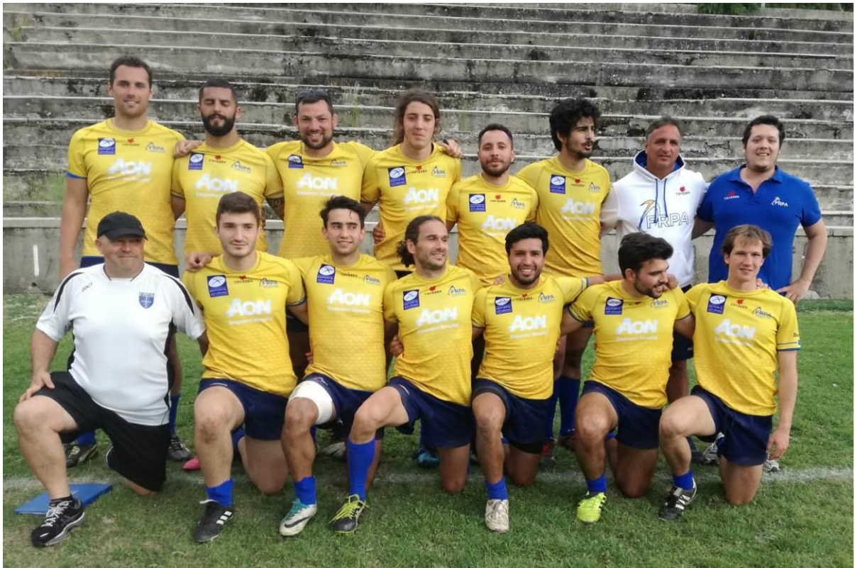
SELECCIÓN MASCULINA DE RUGBY 7 XXVII Torneo Cisneros. Campeón Copa de Bronce. Junio 2018