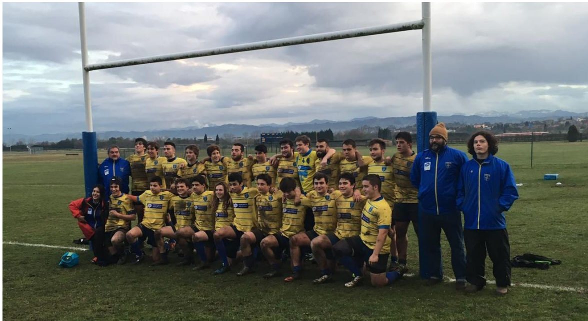
SELECCIÓN MASCULINA S18 ASTURIAS-GALICIA, CESA B, LA MORGAL